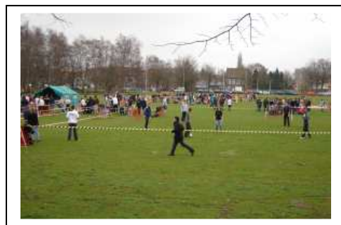
Een totaalbeeld van de activiteiten