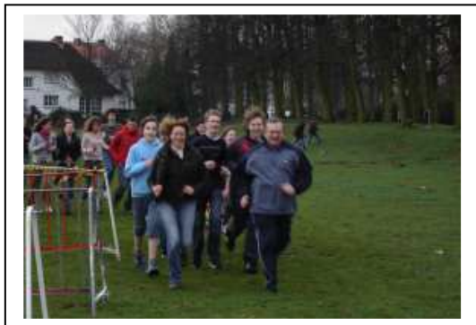
De directeur van de school nam de groep op sleeptouw !