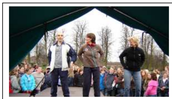
Leerkrachten zorgen voor enkele podiumacts om de sfeer er in te houden.