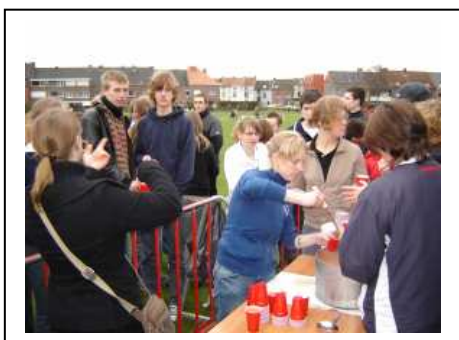
Bereidwillige handen schonken de zelf gemaakte soep. Een warme opkikker op deze frisse dag.